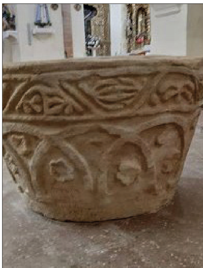
VISTA TRASERA. ESTADO FINAL