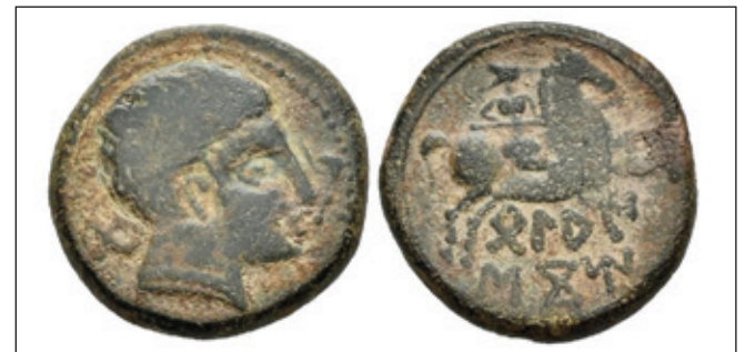
Subasta Tauler & Fau

- Reverso : Jinete lancero a derecha, debajo leyenda en caracteres Ibéricos "Belaiskom" en dos líneas, gráfila lineal.