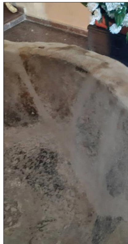
REJUNTADO Y RELLENADO DE LLAGAS RESULTANTES DEL PASO DE ADHERENCIA