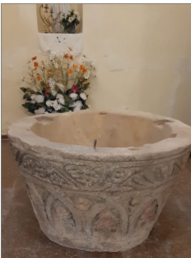
PARTE DELANTERA. ESTADO FINAL