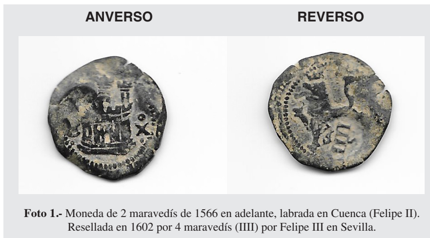
Foto 1.- Moneda de 2 maravedís de 1566 en adelante, labrada en Cuenca (Felipe II). Resellada en 1602 por 4 maravedís (IIII) por Felipe III en Sevilla.

La principal consecuencia para el gobierno del emperador Carlos I y sus herederos fue que Castilla era el único territorio donde tenía jurisdicción en materia fiscal, es decir, capacidad para imponer impuestos, y esto complicó enormemente su gobierno. El imperio español de aquella época gastó mucha energía y dinero librando guerras para mantener y expandir sus territorios: una guerra de casi un siglo contra Francia por el control de Italia, otra de 80 años en los Países Bajos y, en el siglo XVII, una terrible guerra religiosa de 30 años, centrada en Alema-