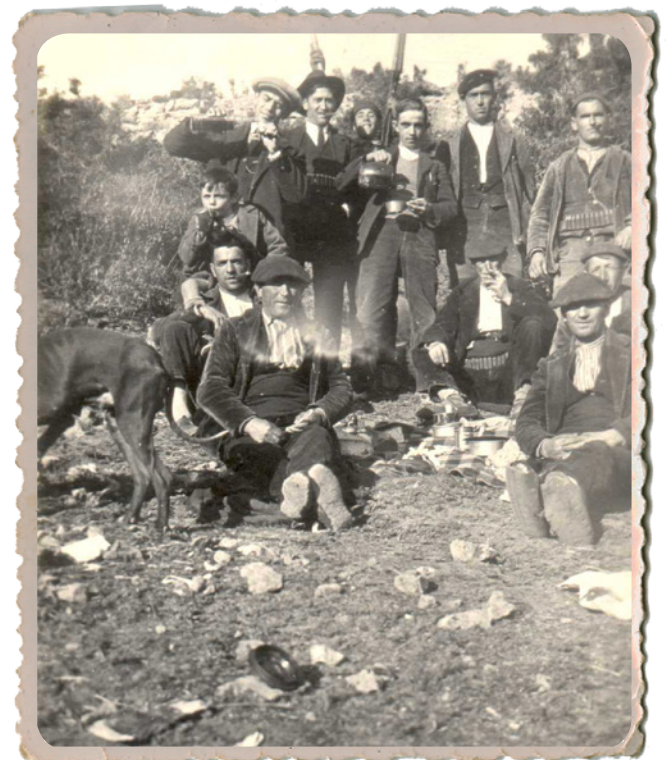
El café y en marcha (1929)