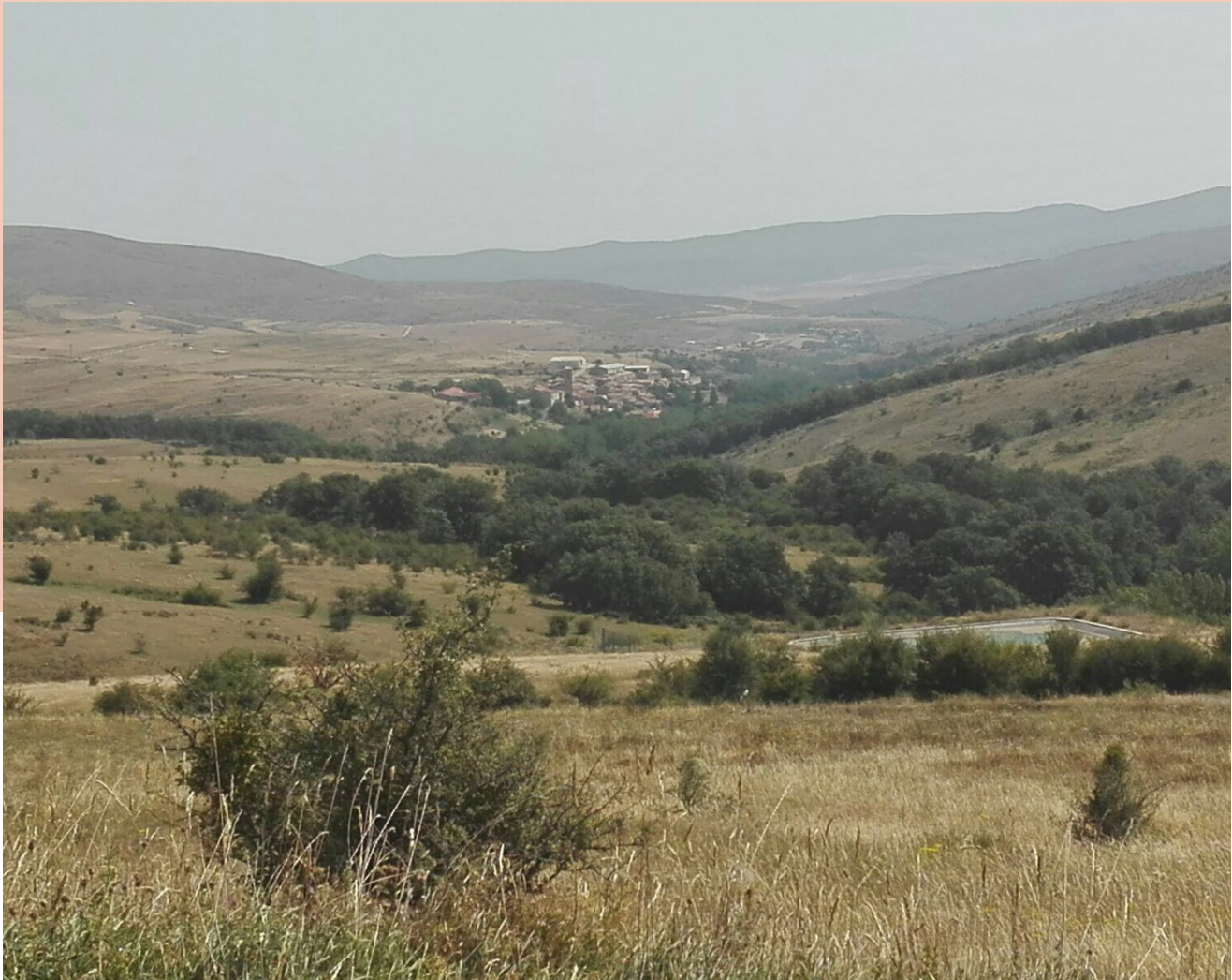
Vista de Oncala en la actualidad

Javier García Martínez. Asociación Numismática Hispania. www.monedasantiguas.org