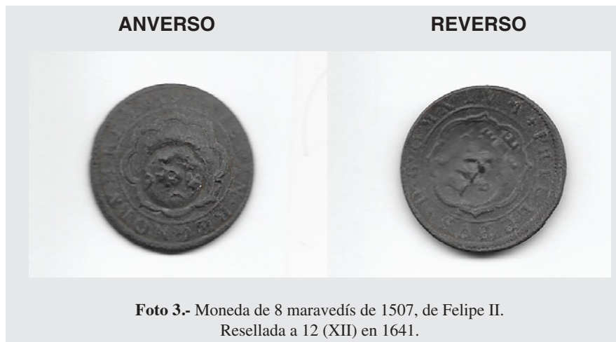
Foto 3.- Moneda de 8 maravedís de 1507, de Felipe II. Resellada a 12 (XII) en 1641.

De esta manera el poder del rey descansaba sobre una situación fiscal precaria y el poder general sobre sus propias élites estaba limitado por las costumbres y por la ley, por lo que el absolutismo español era demasiado débil para enfrentarse a dichas élites. Existía, como en otros países euro-