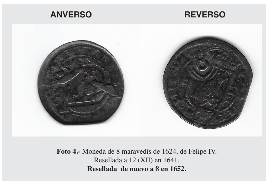
Foto 4.- Moneda de 8 maravedís de 1624, de Felipe IV. Resellada a 12 (XII) en 1641. Resellada de nuevo a 8 en 1652.

Sin embargo, la peor consecuencia de las constantes guerras y la interminable necesidad de fondos, fue la creación del estado patrimonial, es decir, a partir de la bancarrota de 1557, la Corona