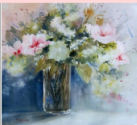
Armonía 56 x 51 cm