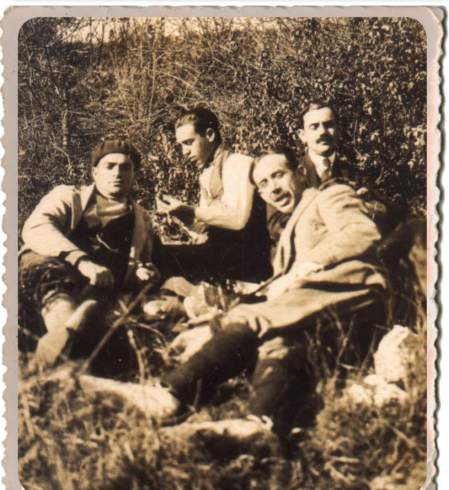
Grupo Caza (1922)