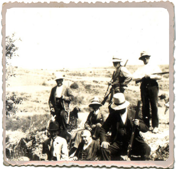
Grupo Caza (1922)