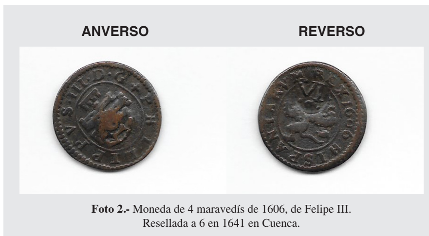
Foto 2.- Moneda de 4 maravedís de 1606, de Felipe III. Resellada a 6 en 1641 en Cuenca.

nia, que acabó en muerte por hambre o violencia con el treinta por ciento de la población rural de ese país.